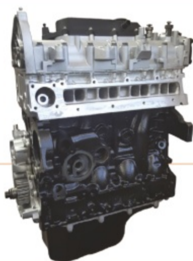
Motore Revisionato Semicompleto Fiat/Iveco F1AE: kit motore con testata completa, coppa olio e coperchio punterie (mancano tutti gli accessori, come collettori, turbina, distribuzione, iniezione, ecc...)