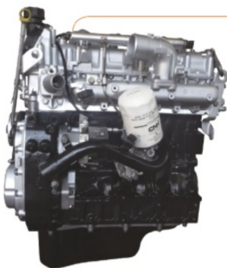
Motore Revisionato Completo Fiat/Iveco F1CE: completo di iniezione, distribuzione, collettori, turbina, pompa acqua

I motori di maggiore movimentazione che vengono revisionati presso Sora Rettifiche sono Fiat e Iveco, sia per vetture che per veicoli commerciali e industriali. La gamma Fiat Ducato/Iveco Daily 2.3mjt marcata F1AE, 3.0mjt marcata F1CE, ad esempio, possono essere forniti negli allestimenti semicompleto o completo.